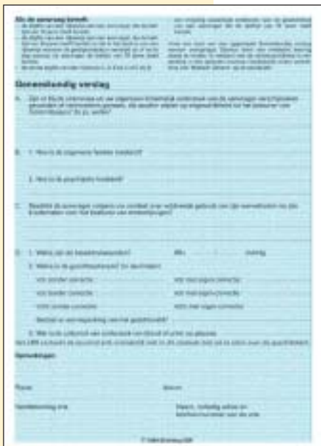
Formulier Geneeskundig verslag.